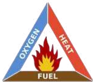
Abbildung 5.1: Verbrennungsdreieck

Das Verbrennungsdreieck ist ein Grundlagenmodell, das dem Verständnis der für einen Brand erforderlichen Elemente dient. Das Dreieck zeigt die drei Elemente Brennstoff, Hitze und Oxidationsmittel (normalerweise Sauerstoff in der Luft), die erforderlich sind, damit ein Brand entsteht.