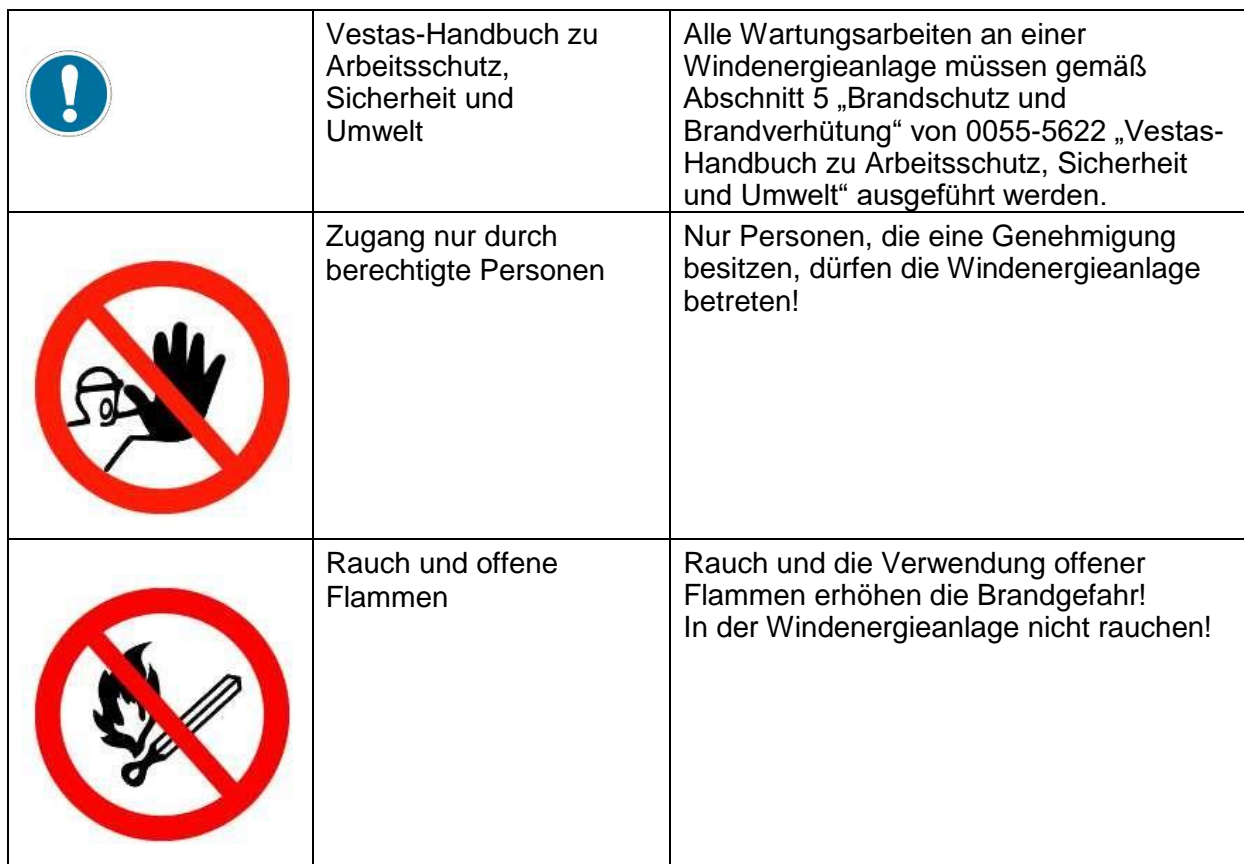
Tabelle 6.1: Mit Brand in Zusammenhang stehende Schilder und Zeichen in Windenergieanlagen

Der Monteur muss bei Wartungsarbeiten in einer Windenergieanlage die mit Brand in Zusammenhang stehenden Schilder und Zeichen kennen und auf diese achten.